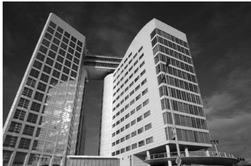
Das Gebäude des Internationalen Strafgerichtshofs

Eine große Rolle spielen natürlich auch Video-Konferenzen, so jetzt auch im Jugoslawien-Tribunal. Viele Zeugen, die in